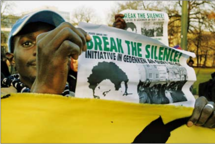
Gedenken Oury Jalloh 2009 in Dessau

In den 1960er & 1970er Jahren wurden in der westdeutschen Solidaritätsszene viele grundsätzliche Hoffnungen auf antikoloniale Befreiungsbewegungen in den Ländern des Südens projiziert. Diese Zeiten sind schon lange vorbei. In Kurzinterviews berichten vier an der Karawane beteiligte FlüchtlingsaktivistInnen über ihre Kämpfe in Europa und wie die dort gesammelten Erfahrungen auf Kämpfe in Afrika bezogen werden könnten.