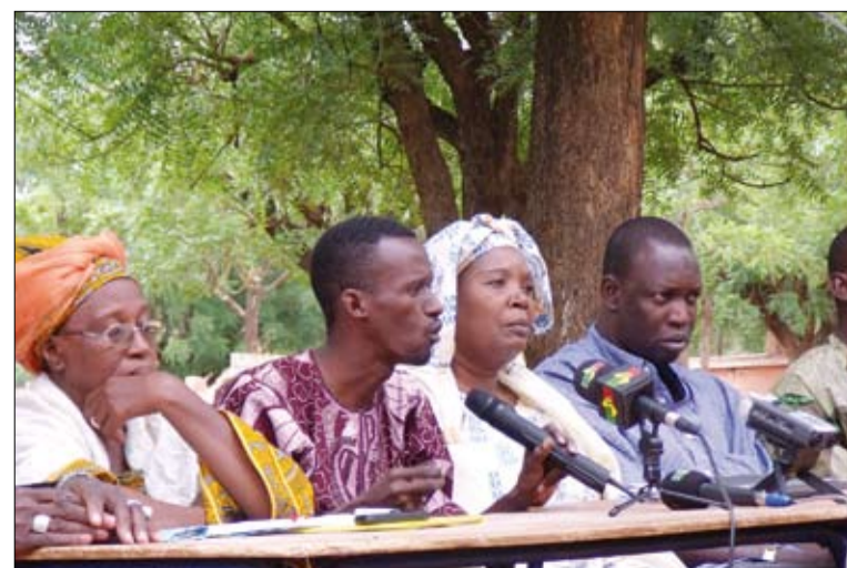
Forum zu Landvertreibungen, Bamako Juni 2010

Spätestens vor dem Hintergrund solcher und vieler weiterer Problemkomplexe dürfte auch die enorme Bedeutung von Migration in Mali nachvollziehbar werden: Ein knappes Viertel der Bevölkerung – also 4 Millionen Menschen – befindet sich in der (Wander-)Migration, die meisten in westafrikanischen Nachbarländern, manche auch in Europa (vgl. Interview S. 3). Die darin zum Ausdruck kommende Selbstermächtigung ist für die Bamako-Dakar-Karawane genauso bedeutsam wie viele der hier (allenfalls) andeutungsweise zur Sprache gekommenen Kämpfe und Auseinandersetzungen.