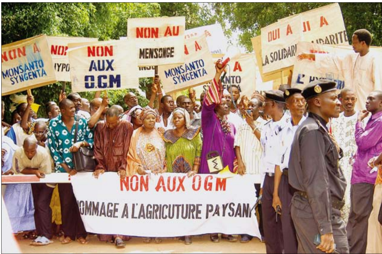
Proteste von Kleinbauern-Organisationen gegen die Einführung von gentechnisch verändertem Saatgut, Bamako 2006

Im Januar 2006 beriet in Sikasso 5 Tage lang eine Jury aus 45 Kleinbauern & -bäuerinnen über die Einführung gentechnologisch veränderten Saatguts in Mali. 20 Lokalradios berichteten live. Das »Nein« am Ende war einstimmig – ein wichtiges Signal im Kampf gegen Monsanto, Syngenta & Co.