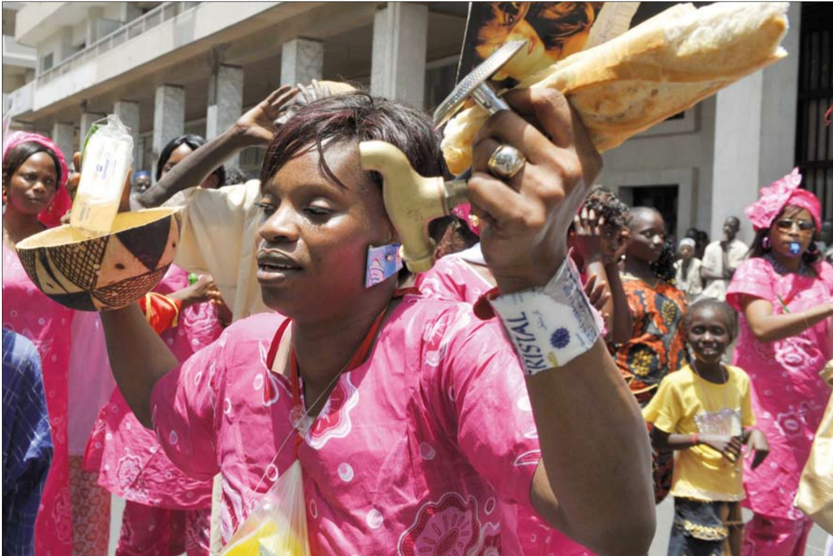
Protest gegen die Erhöhung der Lebenshaltungskosten: 1.Mai-Demonstration 2008 in Dakar/Senegal. Die Demonstrantin zeigt u.a. ein Baguette, einen Wasserhahn und Teils eines Gaskochers

Früher hieß es Internationalismus, heute ist von transnationaler Organisierung von unten die Rede. Auf jeden Fall geht es um globale Solidarität, die gemeinsame Karawane zum WSF ist lediglich ein erster Schritt.