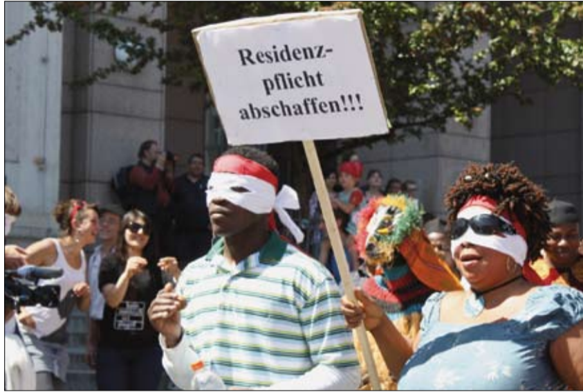
Karawane-Festival in Erinnerung an die Toten der Festung Europa (2010)